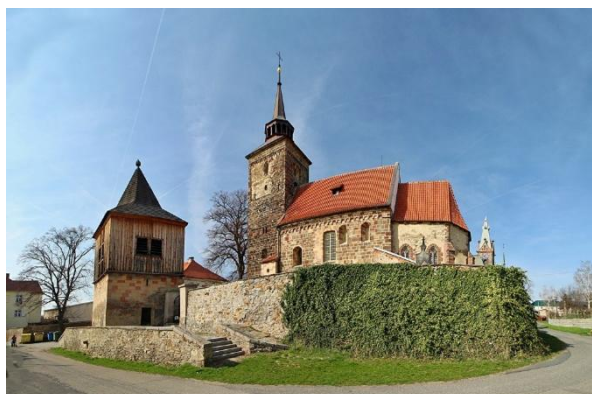
Obrázek 1: Kostel Zvěstování P. Marie se zvonící a kostel Narození Jana Křtitele se hřbitovem